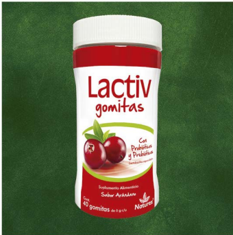
Probióticos y Prebióticos Lactobacilos esporulados