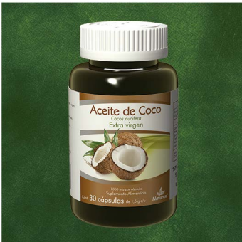
Cocos nucifera Extra virgen